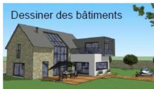
Dessiner des bâtiments

Lycée Le Corbusier 340 Avenue de l'université 78800 St Etienne du Rouvray